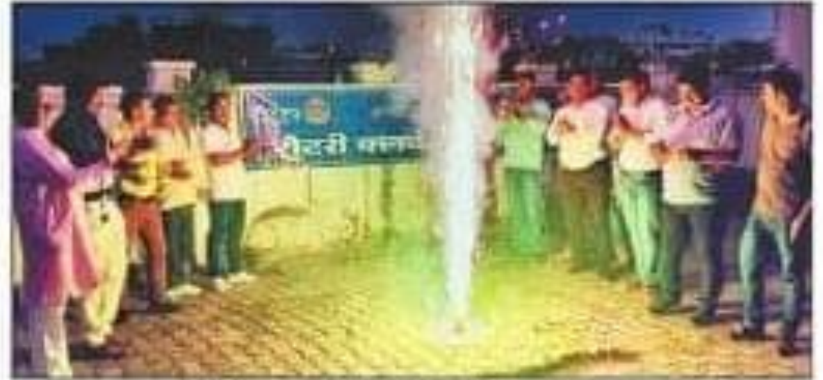
वृद्धजनों के बीच दिवाली मनाते रोटरी क्लब के सदस्य।